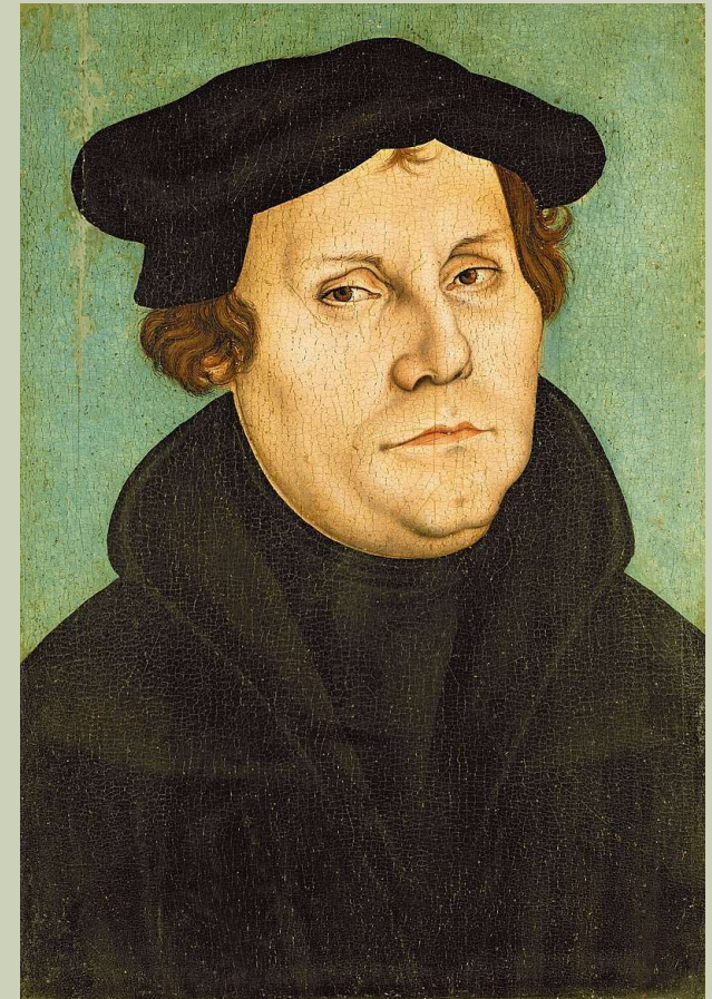
Von Atelier/Werkstatt von Lucas Cranach der Ältere

zitiert von Yvonne Schwengeler in ethos, ohne Quellenangabe