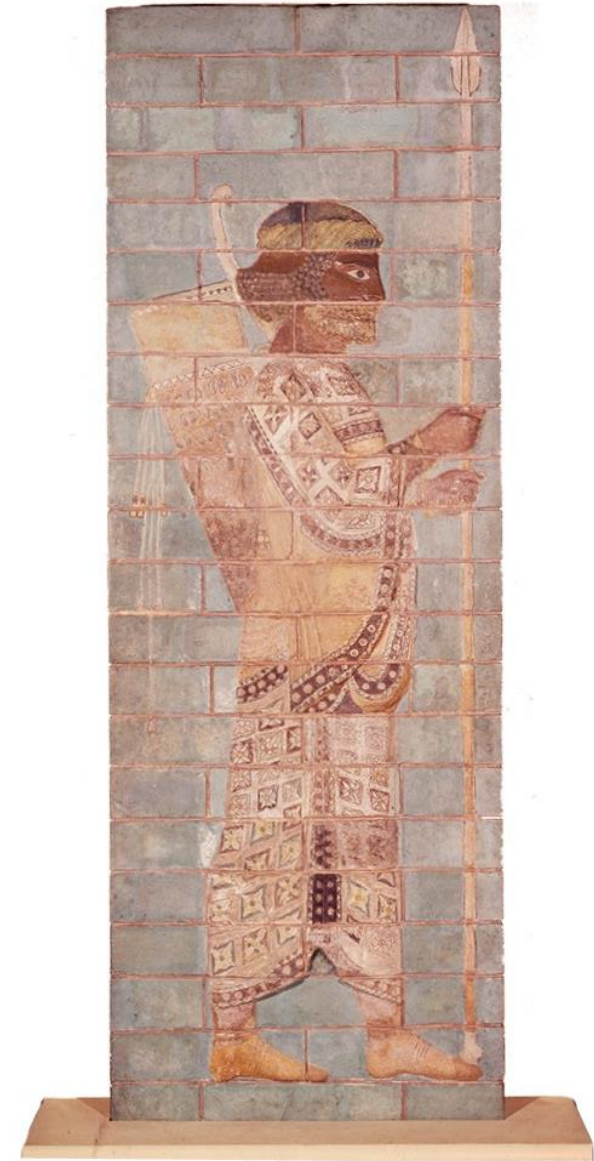
Relief einer persischen Wache im Palast des Perserkönigs Susa