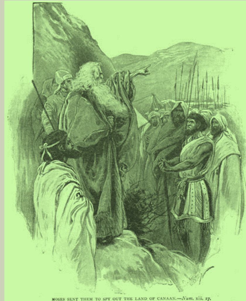
MOSES SENT THEM TO SPY OUT THE LAND OF CANAAN.— Numeri , xiii, 17.