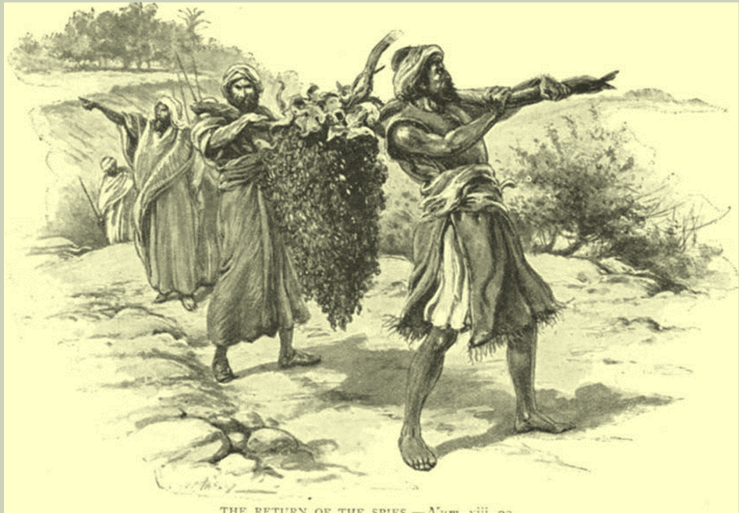
THE RETURN OF THE SPIES — Num. xiii. 22