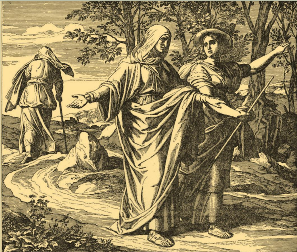
Julius Schnorr von Carolsfeld. Die Bibel in Bildern (1860)