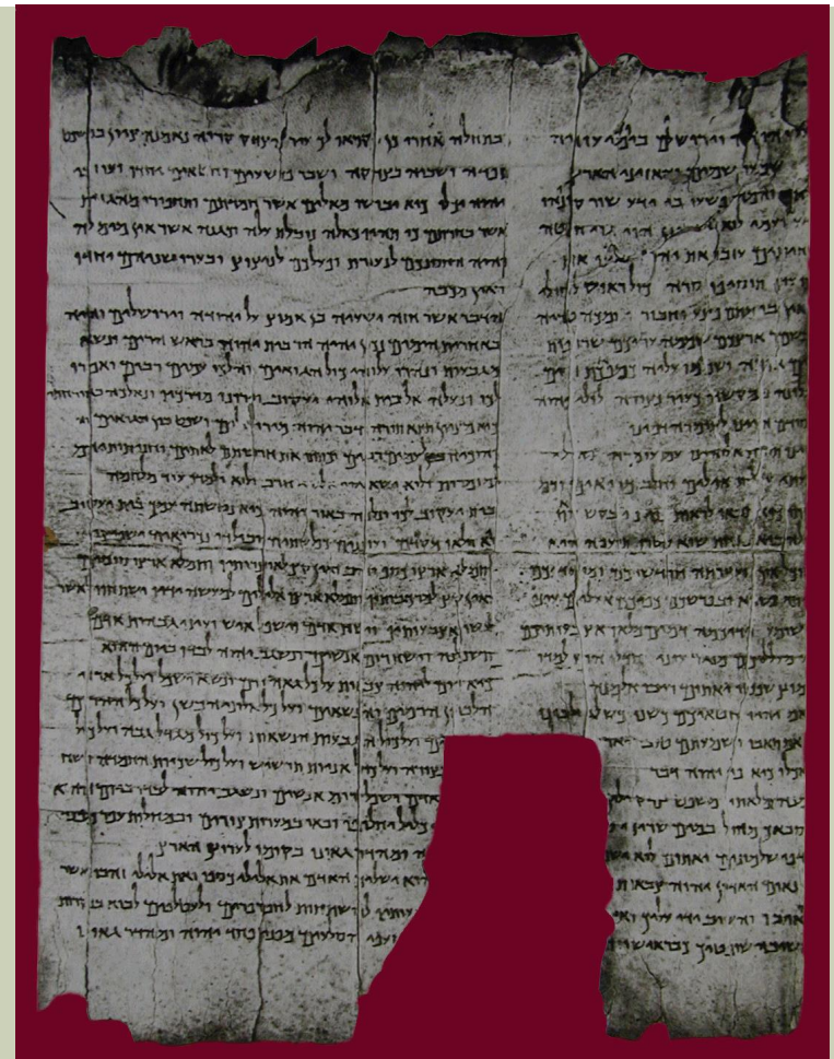
Auszug aus der Jesaja-Rolle. Keine Zäsur zwischen Kap. 39 und 40!