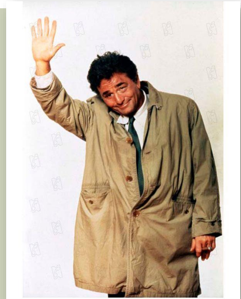
Peter Falk in der Invertierten Detektivgeschichte (aka Howcatchem ) „Columbo“ (1971-2003)